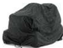
505 63 08-70 Kapell

Heltäckande kapell för riders. Tillverkat i vattenavvisande nylon. Justerbart längst ner samt med ventilationshål.