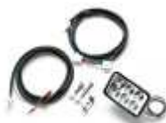
581 12 54-01 Belysningskit

För skärning och justering av gräskanter. Inställbart skärdjup. Vändbar för att lägga tiltan på ut- eller insidan.