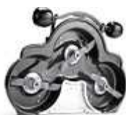
967 15 23-01 Klippaggregat - Combi 103 103 cm Combi-