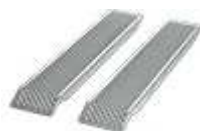
505 69 90-44 Lastramper

Genomgående tillverkade i havsvattentålig aluminium med den välkända halkskyddsytan O3, som ger alla slags hjul ett gott grepp även i våta och hala miljöer. Lastramperna passar väl för användning på släpkärror och för en maximal total belastning om 1 000 kg per par. Ramperna säljs i par. Dimensioner: 260x1500x60 mm.