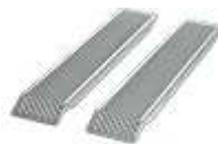
505 69 90-42 Lastramper

Lastramper av havsvattentålig aluminium med den välkända halkskyddsytan O3, som ger alla slags hjul ett gott grepp även i våta och hala miljöer. Lastramperna passar väl för användning på släpkärror med en maximal höjd om 700 mm och för en total belastning om 450 kg per par. Ramperna säljs i par. Dimensioner: 200x1500x35 mm.