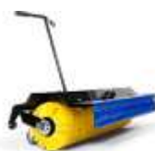
587 02 47-01 Borste Roterande borste för att sopa upp löv, snö etc.