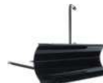
965 07 09-01 Snöblad Robust snöblad med stålskär. Gummiskär finns