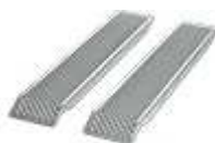
505 69 90-45 Lastramper

Genomgående tillverkade i havsvattentålig aluminium med den välkända halkskyddsytan O3, som ger alla slags hjul ett gott