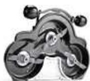
967 15 22-01 Klippaggregat - Combi 94 94 cm Combi-klippaggregat med möjlighet till både