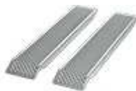
505 69 90-40 Lastramper

Heltäckande kapell för riders. Tillverkat i vattenavvisande nylon. Justerbart längst ner samt med ventilationshål.