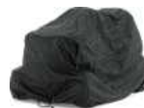
505 63 08-70 Kapell

LED-belysningskit för att göra arbetet lättare när det är mörkt ute, bred ljusfördelning och låg strömförbrukning. 30 000 timmars livslängd vid normal användning. Passar alla Frontriders.