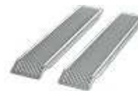
505 69 90-44 Lastramper

Lastramper av havsvattentålig aluminium med den välkända halkskyddsytan O3, som ger alla slags hjul ett gott grepp även i våta och hala miljöer. Lastramperna passar väl för användning på släpkärror med en maximal höjd om 700 mm och för en total belastning om 450 kg per par. Ramperna säljs i par. Dimensioner: 200x2000x50 mm.